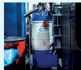
POWERVAC 30 MIT LEICHTLAUFROLLEN