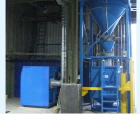
KOMPAKTSAUGAGGREGAT R MIT FILTERVORABSCHIEDER