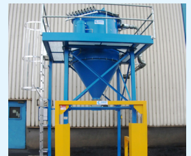
FILTERVORABSCHIEDER MIT TASCHENFILTER