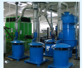
CENTRAL SV MIT FILTERVORABSCHIEDER