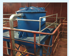
FILTERVORABSCHIEDER MIT TASCHENFILTER