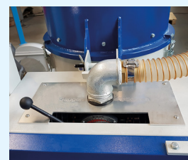
SAUG- UND DRUCK- UMSCHALTWEICHE