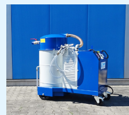
HYDROVAC MIT LEICHTLAUFROLLEN