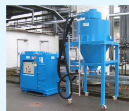
POWERVAC 220 MIT VORABSCHIEDER 1000 L