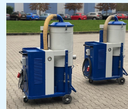
POWERVAC 40-75 MIT LEICHTLAUFROLLEN