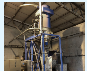
FILTERVORABSCHIEDER MIT KONISCHER FILTERPATRONE